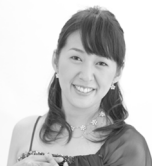
歌ソプラノ 丸山 晃子