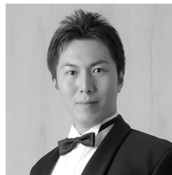
歌テノール 細井 康太